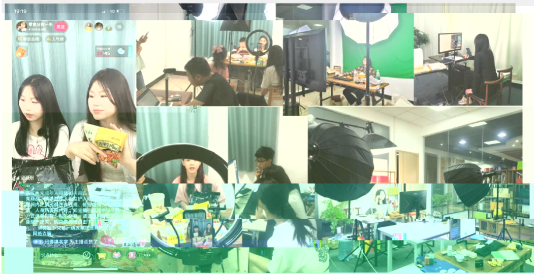
部份学员正在进行电商直播实训现场